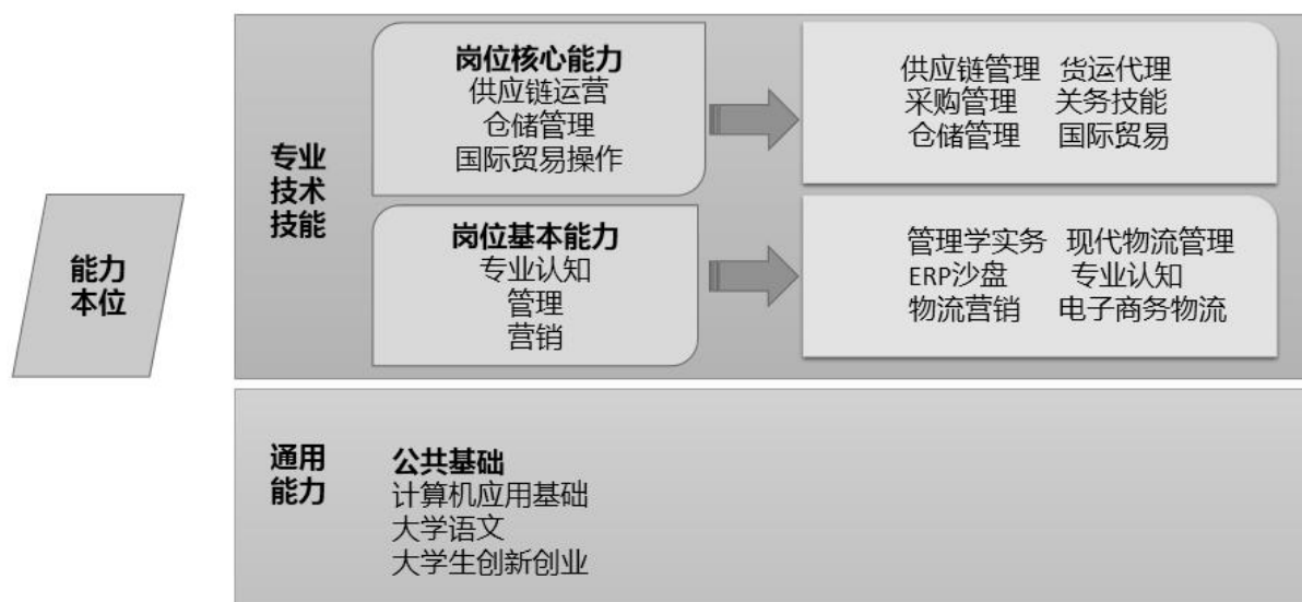
图2 “能力本位”课程体系图