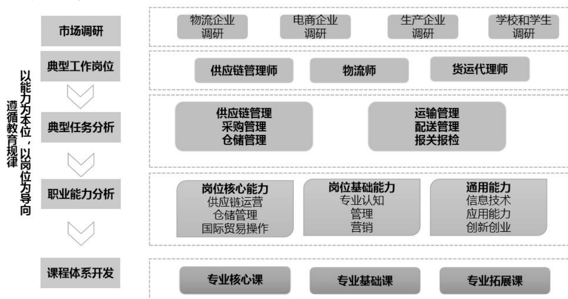
图 1 现代物流管理专业课程体系开发流程图

根据对物流行业的市场调研，引入企业划分工作领域，确定工作岗位，对工作岗位及典型工作任务的分析，确定职业素质与职业能力要求，按照教育规律和职业素质与职业能力要求构建课程体系。现代物流管理专业课程体系开发流程见图 1 所示。