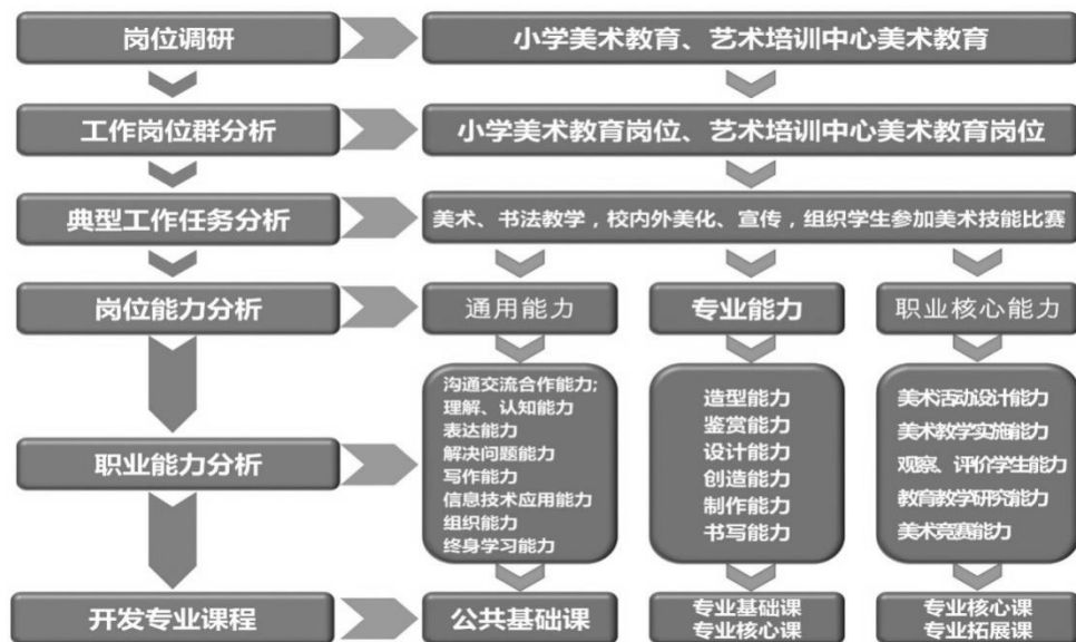
图1 课程开发思路示意图