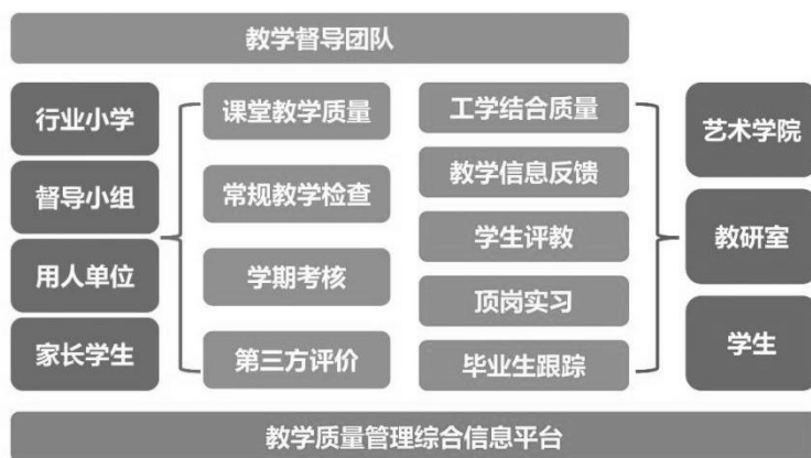
图6 教学质量管理体系示意图

本专业在学校“1234”教学质量监控体系的质量管理综合信息平台上，构建了以促进学生可持续发展为中心的质量保障体系，一方面加强校内外实训场地建设、师资培养培训等教育投入；在教学督导方面，制订了《教学质量督导听课与评课制度》、《教师课堂教学评价与反馈制度》等制度，组建了由学院督导组、行业小学、用人单位以及学生家长共同组成的教学督导团队，通过对教学过程和质量标准实施“双向监控”，建立包括课堂教学质量、常规教学检查、学期考核以及第三方评价的，对教学质量多角度、多方位、多层次的过程性教学质量检查、评价与控制，形成学校、学院、教研室三级管理的教学监管共同体，督促和规范教师教学行为，确保教学质量。