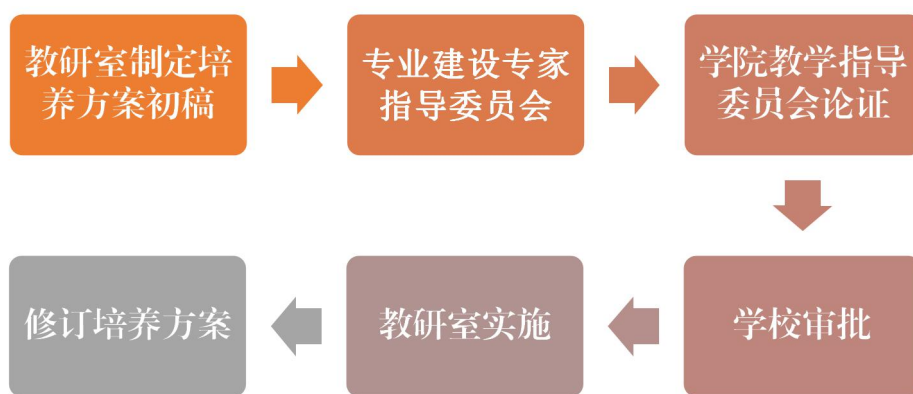
图3 人才培养方案实施流程