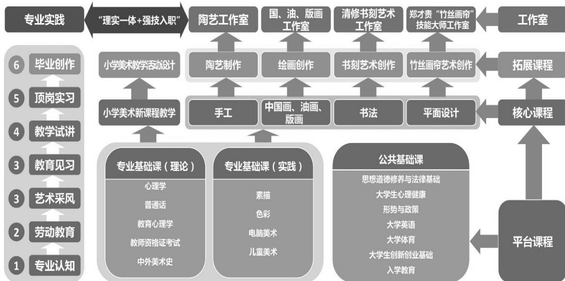
图2 “理实一体+强技入职”课程体系示意图

立足人才培养目标，以就业为导向，由艺术学院、广安市美术家协会以及各区市县实习基地学校共同参与，构建培养学生专业技能和职业能力“二元共融”的“理实一体+强技入职”课程体系。围绕《小学美术新课程标准》划分的学习领域，制定相应的课程，培养学生在画、书、做、设计、赏五个方面的核心能力。