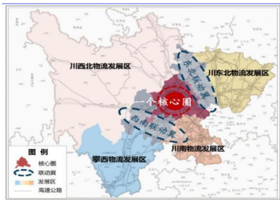
图2 四川省“十四五”物流空间布局示意图

从发展定位看，广安市将在“十四五”期间，将建设成长江水运物流网络的主要节点、供应链创新与应用试点城市。从资产总计指标来看，广安位列川东北五市之首。物流业发展后劲充足。