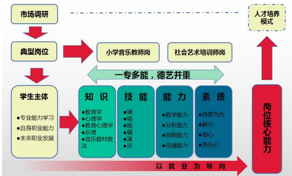
图3 “一专多能 德艺并重”的人才培养模式

本专业通过多方调研与论证，找准本专业职业岗位群，兼顾学生专业能力学习与自身职业能力和未来职业发展，创建了以学生为主体，以就业为导向，以知识为基础、以技能为依托、以能力为本位、以素质为目的“一专多能，德艺并重”的人才培育模式，即：