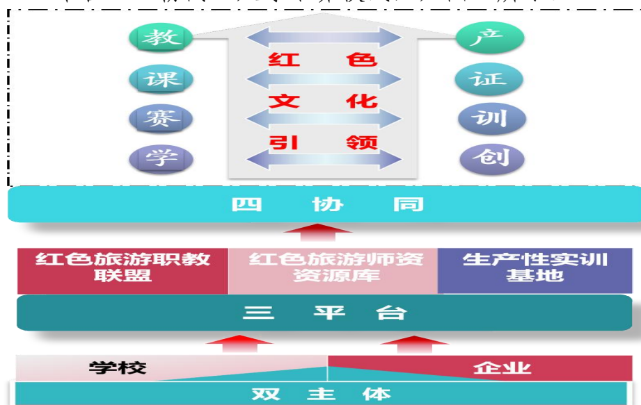
图2 “一主线·双主体·三平台·四协同”人才培养模式

在广安职教集团旅游职教中心的平台上，结合旅游行业对人才的需求，通过对旅游企事业单位的调研，根据本专业所确定的职业岗位群，分析岗位实际工作任务，得出对应的职业能力，构建了“一主线·双主体·三平台·四协同”人才培养模式，如图3所示。